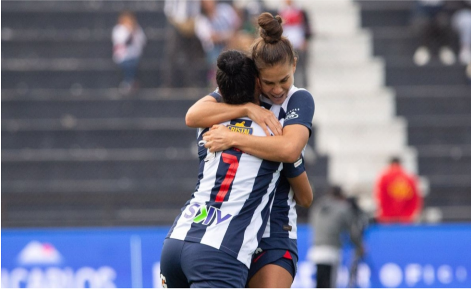
De inicio a final. Alianza Lima demostró su poderío en Matute al derrotar 4-1 a Univer-