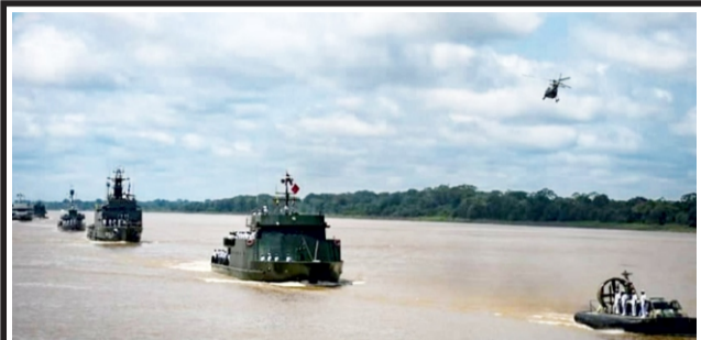
Con delegaciones de la Marina de Perú, Brasil y Colombia