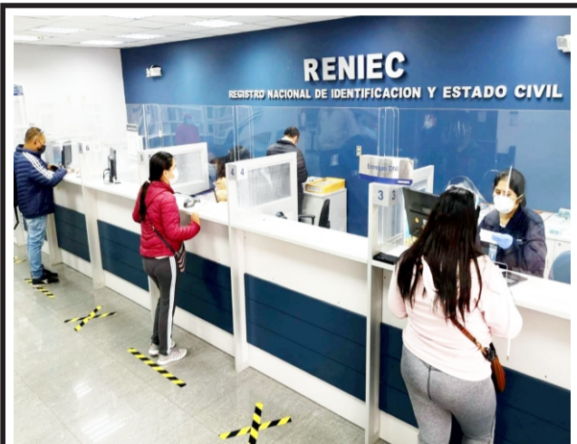
De manera presencial