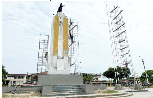
pales espacios públicos de la ciudad se encuentre en adecuadas condiciones para el desarrollo de importantes eventos, visita de la población, entre otros.

modernizar y hermosear el centro cívico para el beneficio de todos los pobladores. Los trabajos contemplan el mejoramiento de la glorieta, renovación de pisos en mal estado, bancas, mejoramiento del obelisco, veredas, áreas verdes, pintado, mejoramiento del alumbrado, entre otros. Estos trabajos permitirán que uno de los princi-