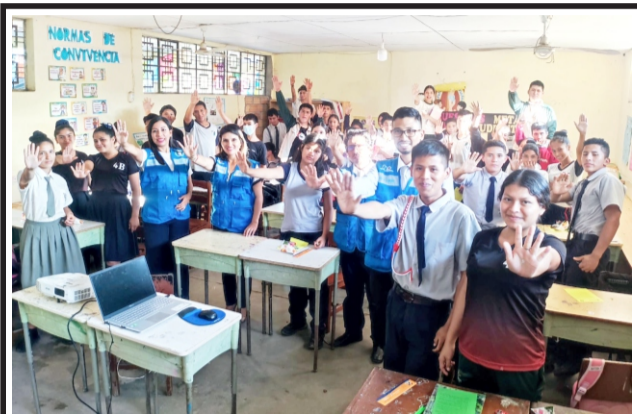
Especialistas de la Unidad de Asistencia a Víctimas y Testigos conversaron con alumnos de Moyobamba: