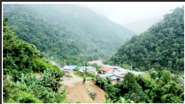
Atalaya y Purús están en alerta