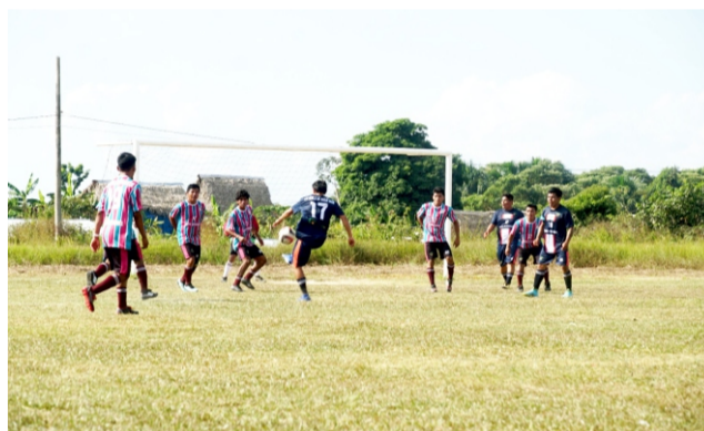
San Juan Bautista

Durante la ceremonia inaugural el popular conductor deportivo "Checho" Ibarra, considerado como el máximo goleador histórico de la primera división del fútbol peruano, tomó emocionado el juramento a los deportistas y luego se dirigió a cada uno de los equipos para estrechar la mano a las jugadoras y los jugadores, manifestándoles su reconocimiento