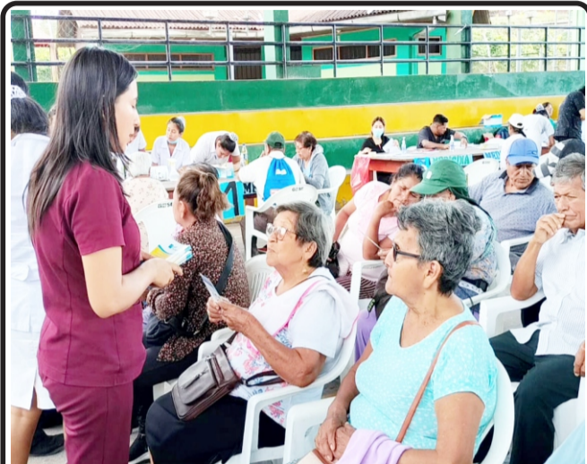
En Aguaytía, en campaña gratuita de atención integral de salud