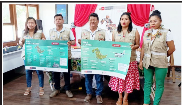
PIAS va a CCNN en salud y programas sociales