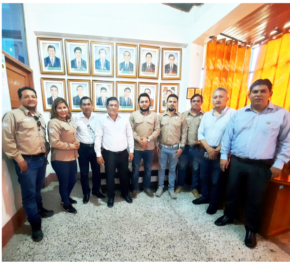
A autoridades de Irazola, para un desarrollo ordenado y sostenible del territorio