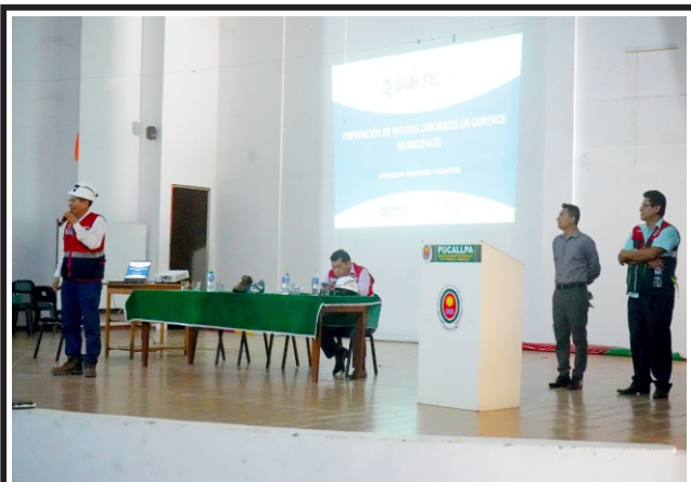
En temas preventivos ante riesgos laborales