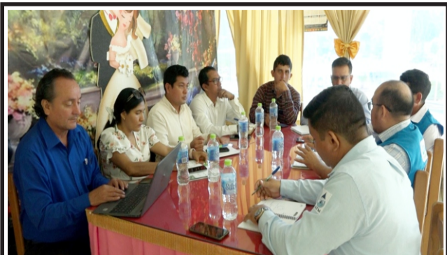
Red de Municipios Y Comunidades Saludables