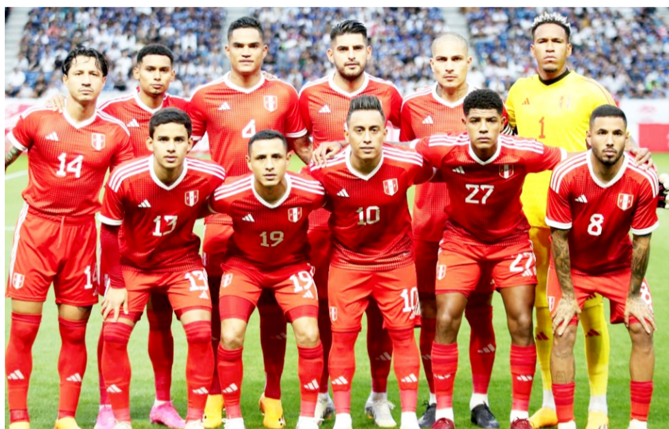
La Selección Peruana cerró su gira por Asia con una contundente goleada en contra de Japón. La 'Bicolor' no pudo por 4-1, frente al combinado de los dirigidos de Hajime

me Moriyasu y sumó su tercera derrota en la era Juan Reynoso.